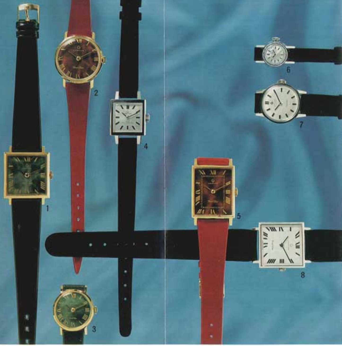
① 2006-136 YGF ¥21,000 ② 2006-146 ¥22,500 ③ 0806-878 ¥25,000 ④ 0801-701 ¥25,500 ⑤ 2006-142 YGF ¥24,000 ⑥ 0601-111 ¥29,800 ⑦ 1101-013 ¥39,000 ⑧ 2029-136 ¥21,000