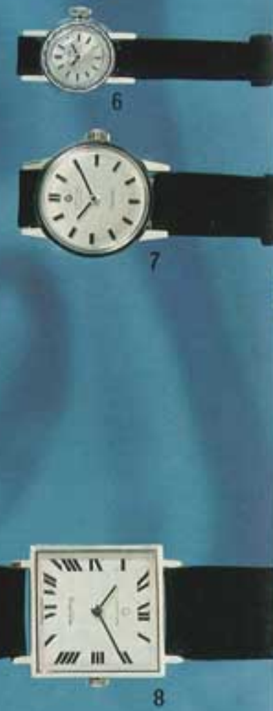
① 0661-367 WG ¥240,000 ② 0861-221 WG ¥144,000 ③ 0861-067 WG ¥195,000