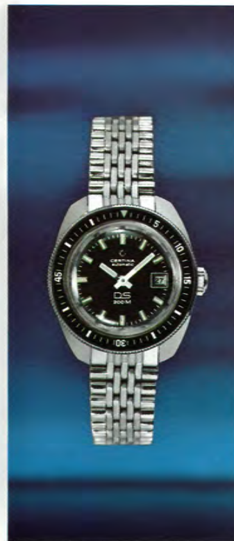
1901 301 Certina-DS Taucheruhr für Damen. Automatic mit Kalender, superstossicher, wasserdicht bis zu 20 atü (200 m Tiefe), drehbarer Ring zum Einstellen der Tauchzeit, verschraubte Aufzugskrone, gut lesbares Zifferblatt.

Die Certina-DS für Damen besitzt die gleichen Merkmale wie die DS-Herrenmodelle. Sie ist automatisch, mit Kalender, superstossicher, superwasserdicht, in Goldplaque oder Stahl erhältlich, mit dem Original-DS-Stahlband oder Corfamband.