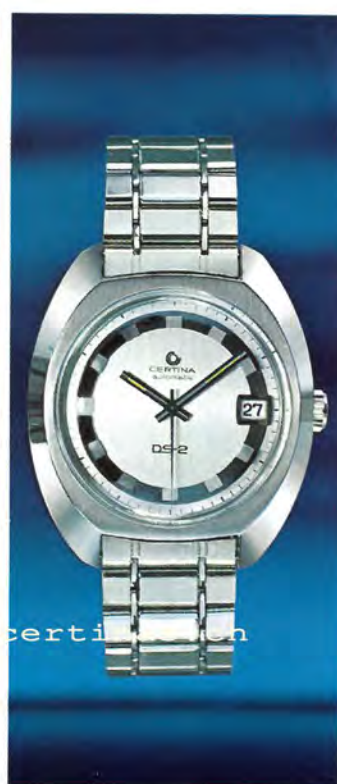
5801 300 C