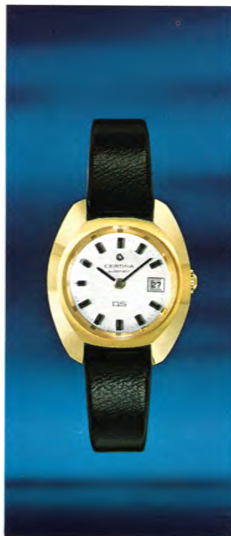
1906 300 Certina-DS für Damen.

Certina-DS für die Frau, die einer besonders widerstandsfähigen Uhr bedarf.