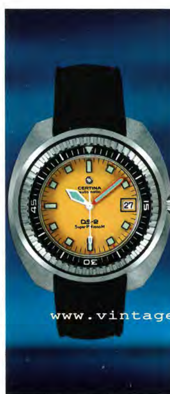
5801 302 Certina-DS Super PH1000M Automatic, mit Kalender, superstossicher, wasserdicht bis zu 100 atü (1000 m Tiefe), drehbarer Ring zum Einstellen der Tauchzeit, gehärtetes Mineralglas (extra-hart), verschraubte Aufzugskrone, gut lesbares Zifferblatt. Dieses Modell wurde speziell für Berufstaucher geschaffen.

Es ist daher nicht erstaunlich, dass die Taucheruhren Certina-DS dank ihren aussergewöhnlichen Qualitäten der Stossicherung oftmals von Männern getragen werden, die den unbekanntenen Welten in grossen Tiefen nachspüren und sie studieren.