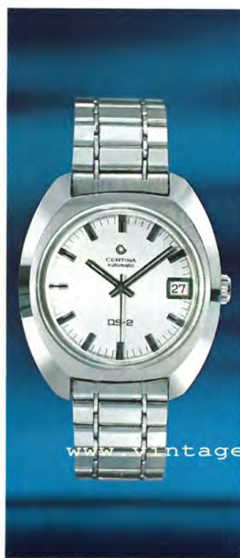
5801 300 B