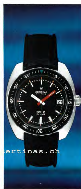
5801 303 Certina-DS PH200M Automatic mit Kalender, superstossicher, wasserdicht bis 20 atü (200 m Tiefe), drehbarer Ring zum Einstellen der Tauchzeit, armiertes Glas, verschraubte Aufzugskrone, gut lesbares Zifferblatt, das Modell für den Sporttaucher.