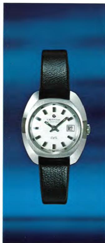
1901 300 Certina-DS für Damen.

Viele Frauen brauchen in ihrer beruflichen oder gesellschaftlichen Tätigkeit eine Präzisionsuhr von grosser Widerstandsfähigkeit. Für sie hat Certina ein DS-Modell für Damen geschaffen, das dieselben Vorteile an Robustheit und Wasserdichtigkeit bietet wie alle andern Modelle der Serie DS.