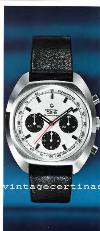
8501 300 Certina-DS Chronolympic Chronograph, superstossicher, superwasserdicht, Edelstahl, 3 Zähler (Sekunden, Minuten, Stunden), mit schwarzem oder weissem Zifferblatt erhältlich.

Durch den Gebrauch ist ein Chronograph oft Stößen ausgesetzt, Erschütterungen, dem Risiko des Eindringens von Wasser. Unter solchen Bedingungen ist die Präzision eines gewöhnlichen Chronographen oftmals ungewiss. Der Chronograph Certina-DS indessen ist der einzige, der gleichzeitig vollkommen wasserdicht und stossesichert ist.