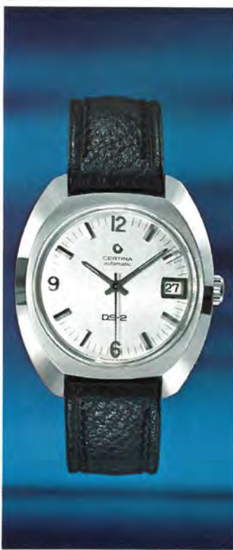
5801 300 A