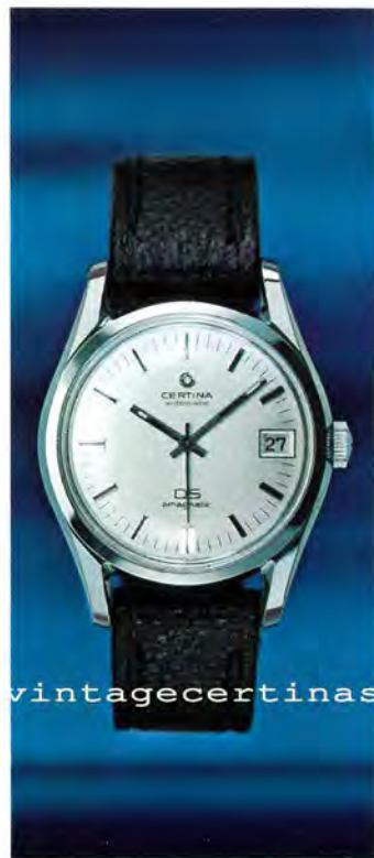
5801 114 Certina-DS Amagnetic Automatic mit Kalender, superstossicher, superwasserdicht, amagnetisch bis zu 800 Oersted (Gauss), mit Original-DS-Stahlband oder mit Corfamband.

Ingenieure, Physiker und Techniker müssen oft in der Umgebung von Magnetfeldern arbeiten, die den genauen Gang einer gewöhnlichen Uhr stören. Die Certina-DS Amagnetic widersteht dem permanenten Einfluss bis zu 600 Oersted (Gauss) und selbst dem Magneteinfluss bis zu 800 Oersted auf kurze Zeit.