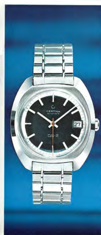
5801 300 D