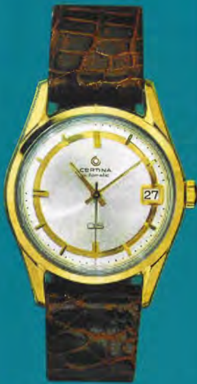
5827 112 Certina-DS Zifferblatt C