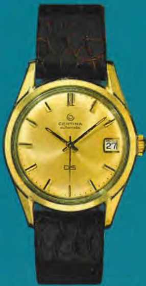
5827 112 Certina-DS Zifferblatt B champagne