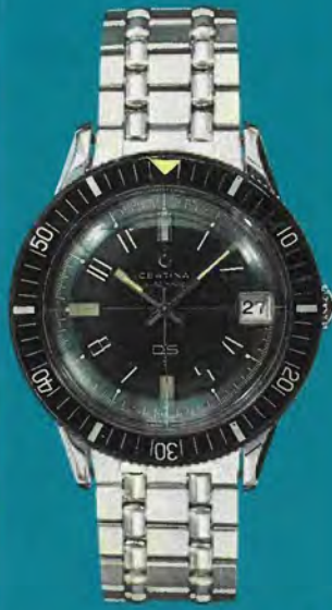
5801 113 Certina-DS Spezial-Modell für Taucher; Automatic, mit oder ohne Kalender, superstoßsicher, superwasserdicht, Edelstahl, mit drehbarem Glasrand zur Bestimmung der Tauchzeit, Original-DS-Stahlband.