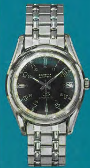
5801 114 Certina-DS Amagnetic

Automatic, Kalender, superstoßsicher, superwasserdicht, in «Golden Armour» (14 Kt., 250 Mikron dicker Goldpanzer auf besonders widerstandsfähige Stahlschale gelötet), mit echtem Krokolederband.