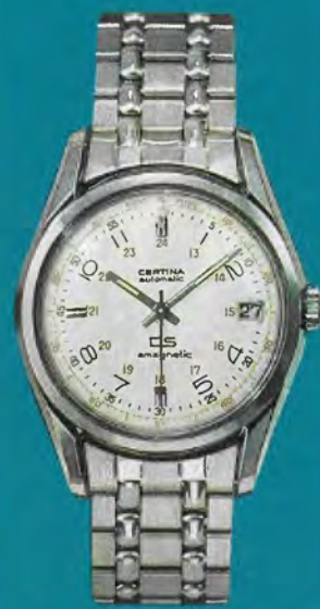
5801 114 Certina-DS Amagnetic